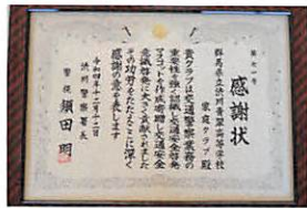
家庭クラブ交通賞状

十二月十一日(日) 渋川市役所本庁舎にて行われた「しぶかわクレート甲子園」に、食