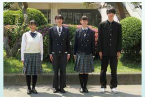
制服（夏服・スラックス・冬服）