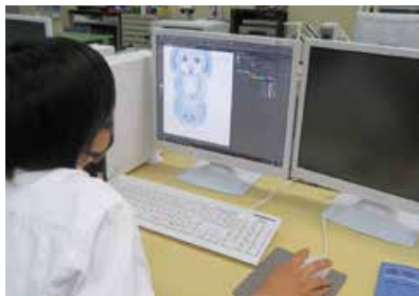
情報デザイン（illustrator使用）

私は将来、中学生の頃に好きになったデザインやCG等の仕事に就きたいと思い、このコースを選択しました。CGコースでは専用のソフトウェアを使い、自分ならではの作品を制作します。パソコンを使ってイラストやポスター等の様々な作品を作るため、創作意欲のある人にお勧めのコースです。